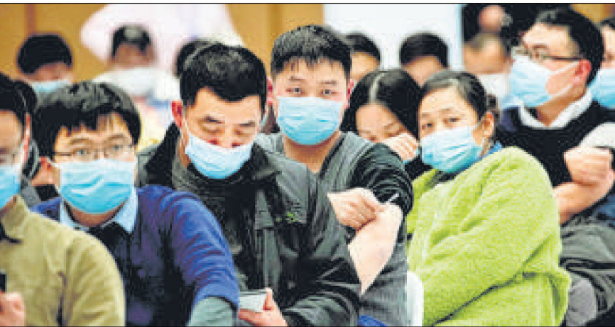
चीन के शंघाई में मंगलवार को एक केंद्र पर कोरोना वायरस का टीका लगवाने के बाद बैठे स्थानीय लोग