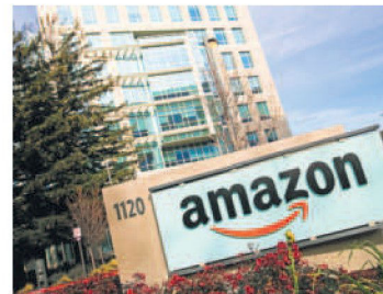
The first batch of the six-month Amazon Global Selling programme will have close to 10 startups