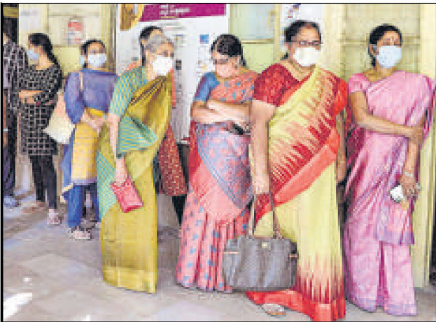
हैदराबाद में मंगलवार को टीका लगवाने के लिए कतार में खड़े चिकित्सा कर्मचारी।