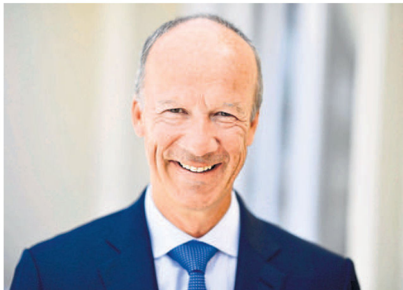
Delaporte's entry, albeit virtually, has augured well for Wipro so far, and in the last six months, he has maintained a laser-sharp focus on execution.

"In each of these regions, we have invested in talent...we have appointed new heads for these countries, both internally and externally. And we have structured specific strategies for each of these countries," Delaporte said in a virtual interview. "In Europe, it's important to combine global expertise and local connects. So, while it's a journey, we have already started to invest in local